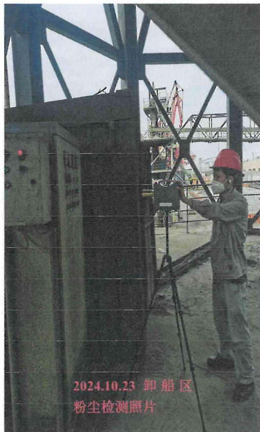
2024.10.23 卸船区 粉尘检测照片