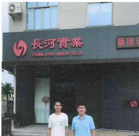
现场调查人员与企业陪同人合照