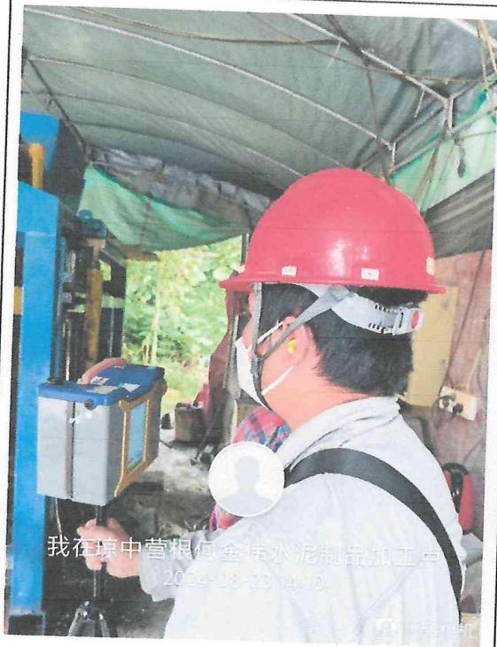
我在琼中营根何金伟水泥制品加工点 2024-08-23 14:10