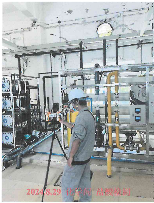
2024.8.29 化学间 盐酸检测