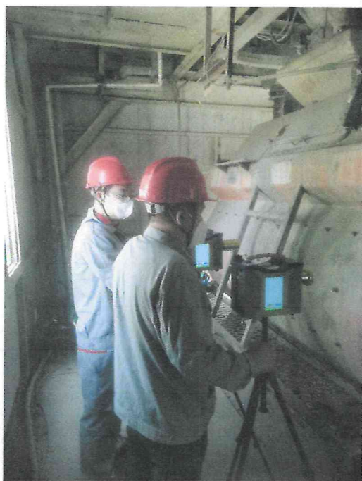
检测日期：2024.6.3 搅拌机粉尘采样