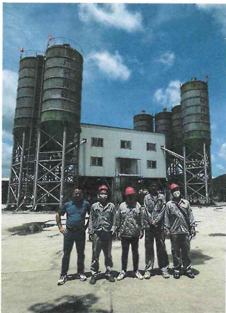
检测日期：2024.6.3 企业陪同人合影