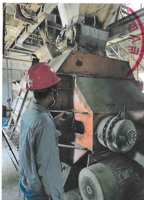
检测日期：2024.6.3 搅拌机噪声检测