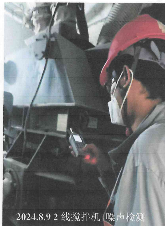
2024.8.9 2 线搅拌机 噪声检测