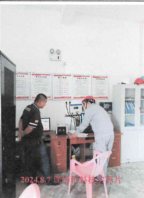
2024.8.7 现场资料核实照片