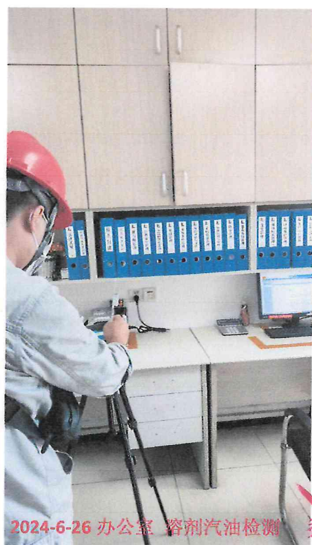
2024-6-26 办公室 溶剂汽油检测