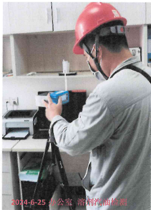
2024-6-25 办公室 溶剂汽油检测