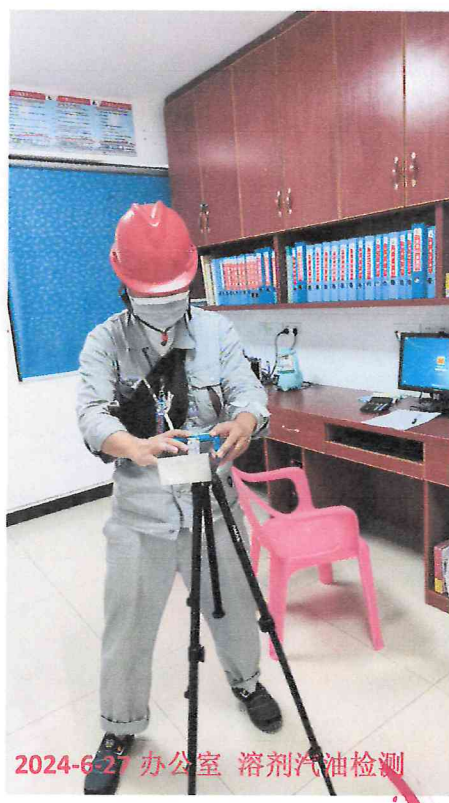
2024-6-27 办公室 溶剂汽油检测