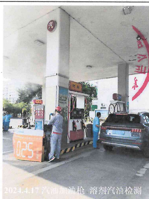
2024.4.17 汽油加油枪 溶剂汽油检测