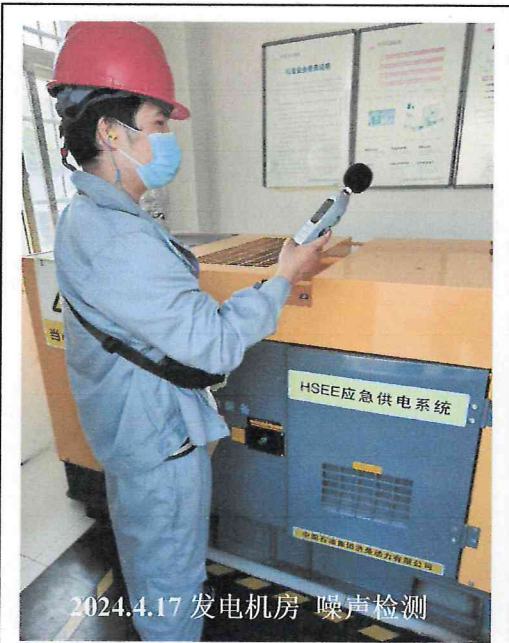
2024.4.17 发电机房 噪声检测