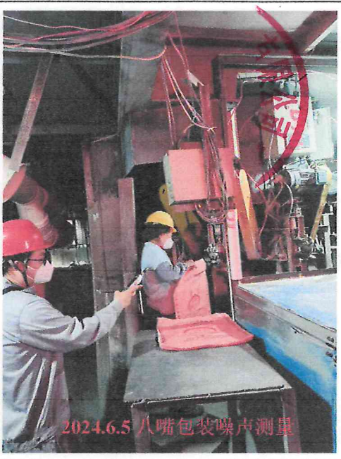
2024.6.5 八嘴包装噪声测量