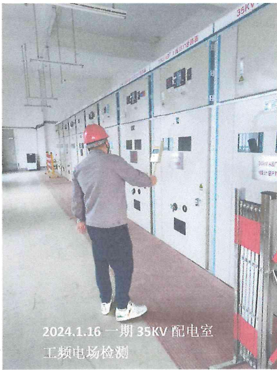
2024.1.16 一期 35KV 配电室 工频电场检测