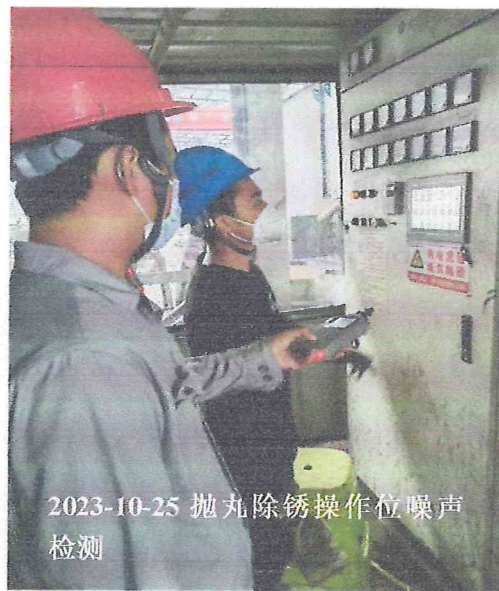
2023-10-25 抛丸除锈操作位噪声 检测