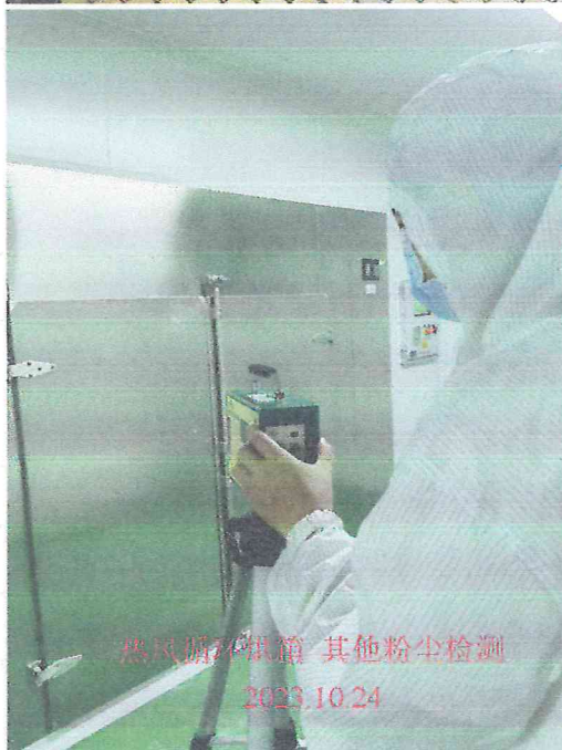
热风循环风箱 其他粉尘检测 2023.10.24