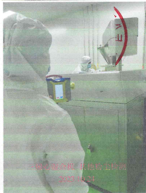
三轴心混合机 其他粉尘检测 2023.10.24