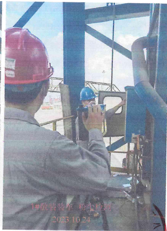
1#散裝裝車 粉塵檢測 2023.10.24