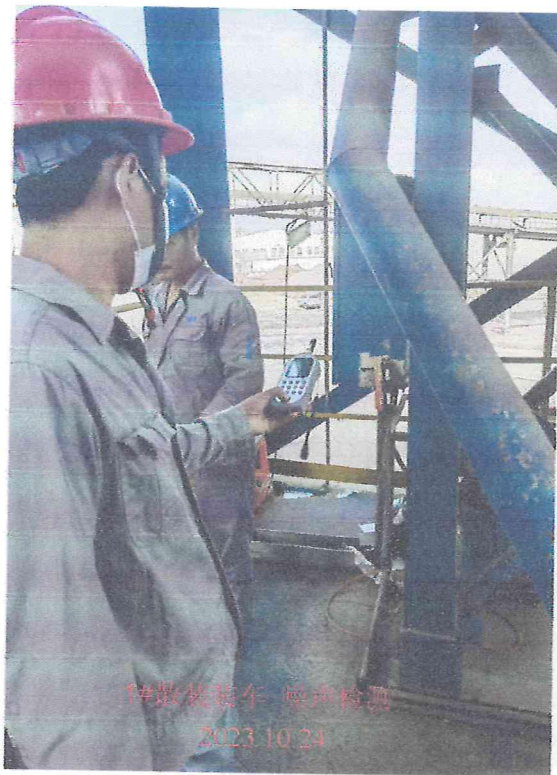
1#散裝裝車 噪聲檢測 2023.10.24