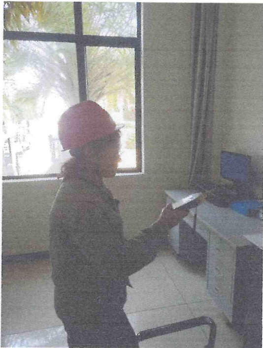
化验室倒班室噪声检测