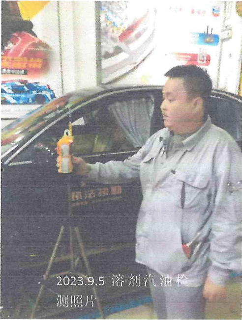
2023.9.5 溶剂汽油检测照片