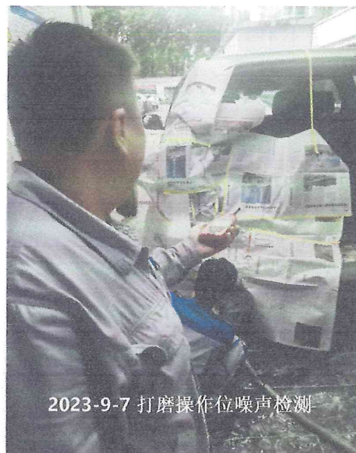
2023-9-7 打磨操作位噪声检测