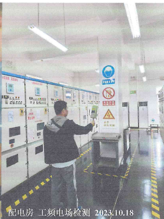
配电房 工频电场检测 2023.10.18