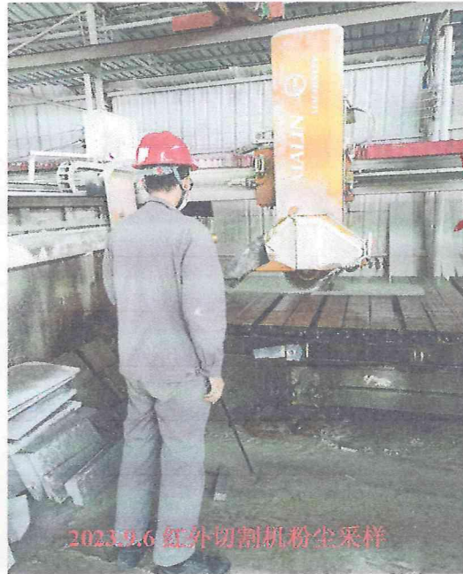
2023.9.6 红外切割机粉尘采样