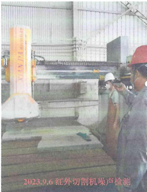
2023.9.6 红外切割机噪声检测