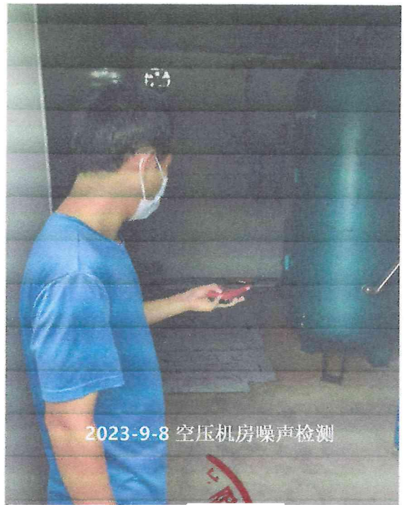
2023-9-8 空压机房噪声检测