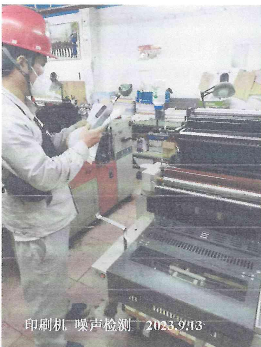
印刷机 噪声检测 2023.9.13