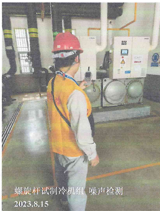
螺旋杆试制冷机组 噪声检测 2023.8.15