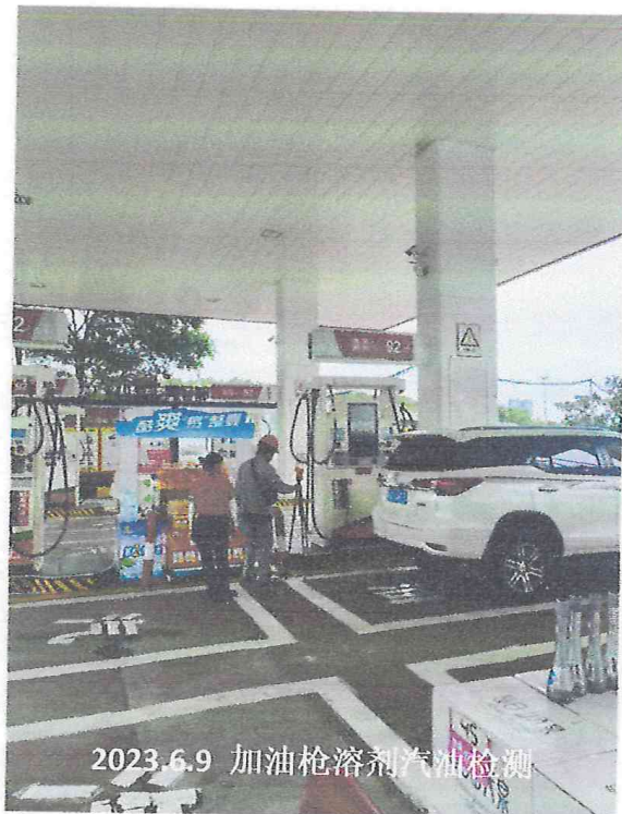
2023.6.9 加油枪溶剂汽油检测