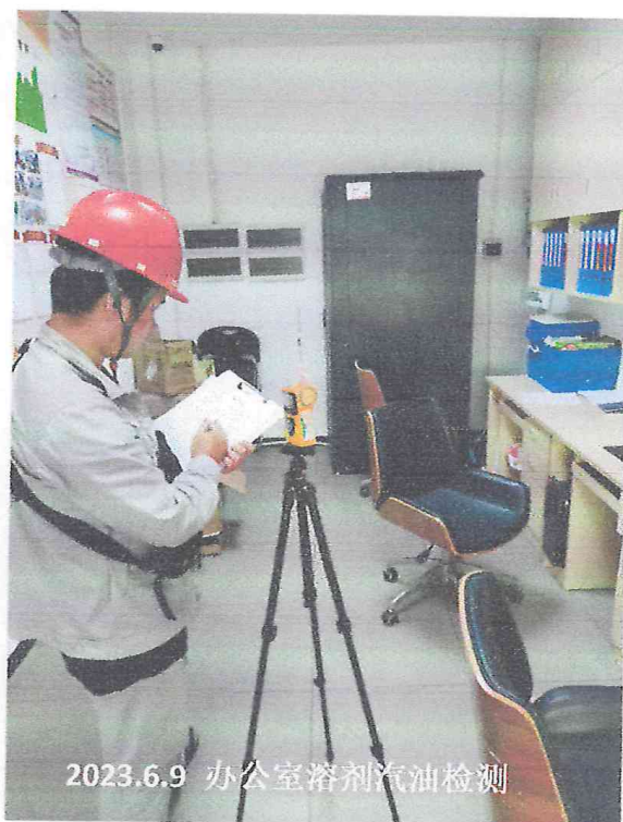
2023.6.9 办公室溶剂汽油检测