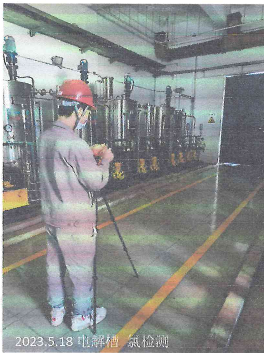
2023.5.18 电解槽 氯检测