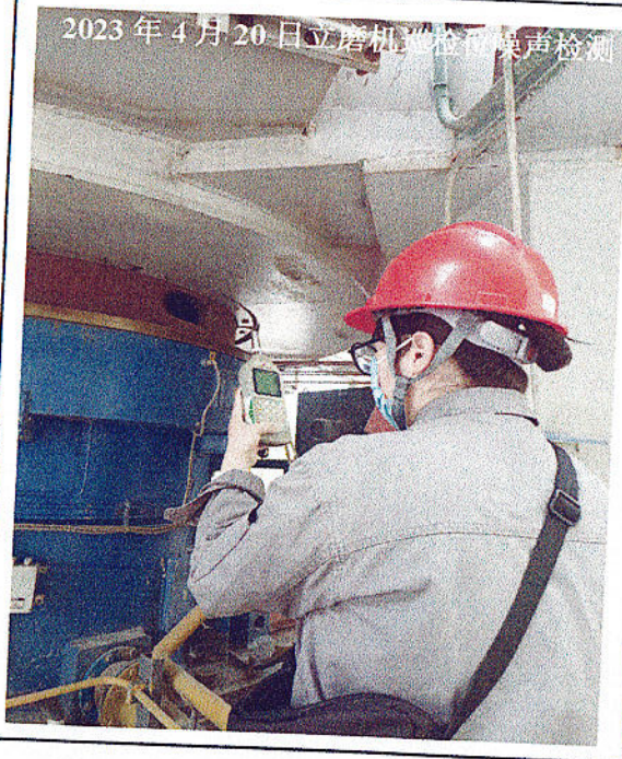
2023年4月20日 立磨机巡检位噪声检测