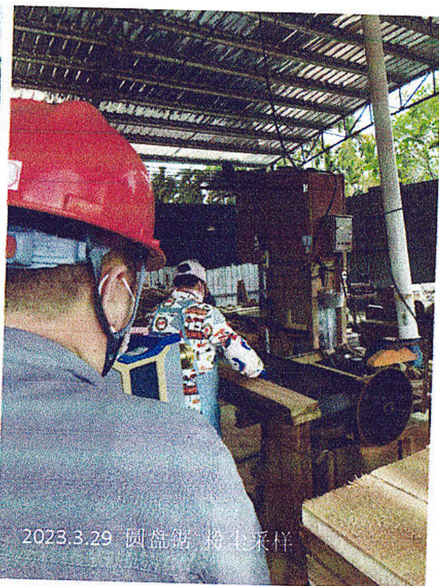
2023.3.29 圆盘锯 粉尘采样