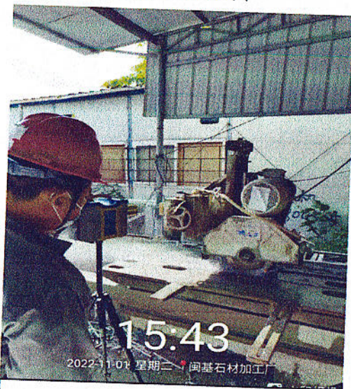
切割操作位粉尘检测