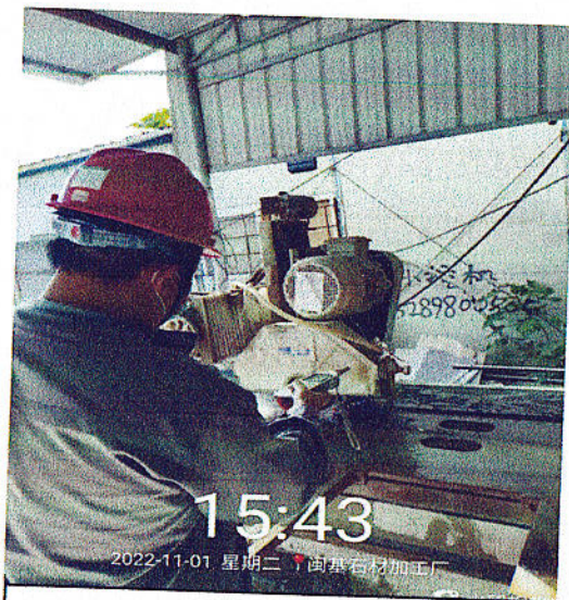
切割操作位噪声检测