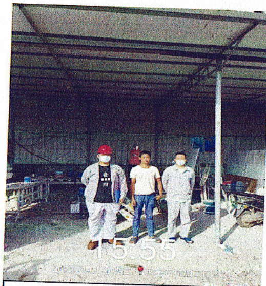
企业人员门口合照