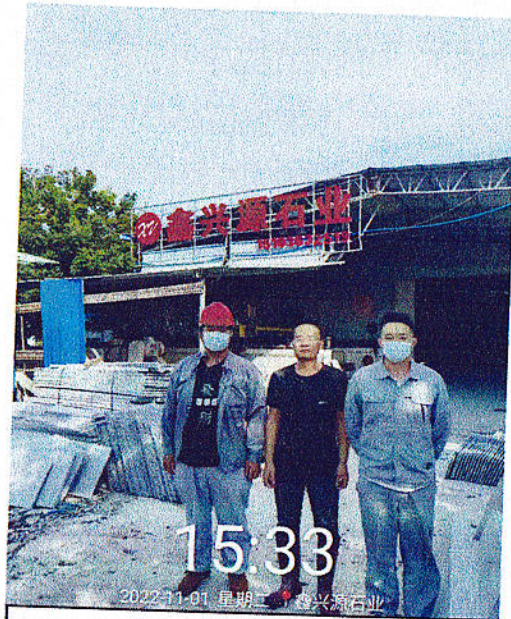
企业人员门口合照