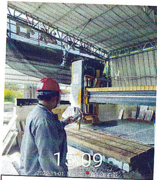
切割操作位粉尘检测