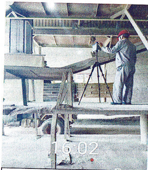
装车平台粉尘检测