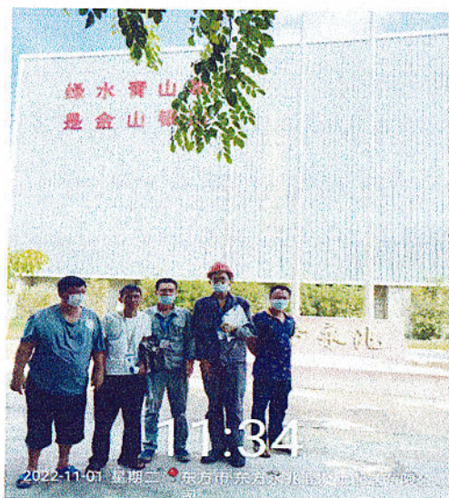
企业人员门口合照