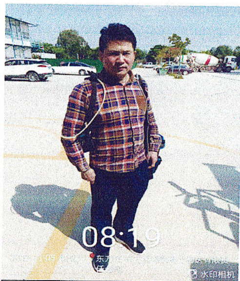
工人个体粉尘检测