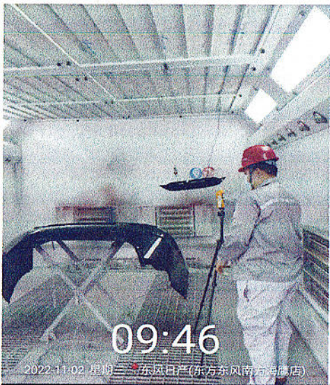
烤漆房有毒物检测