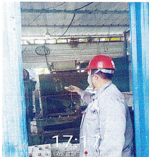
制砖机操作位噪声检测