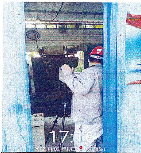
制砖机操作位粉尘检测