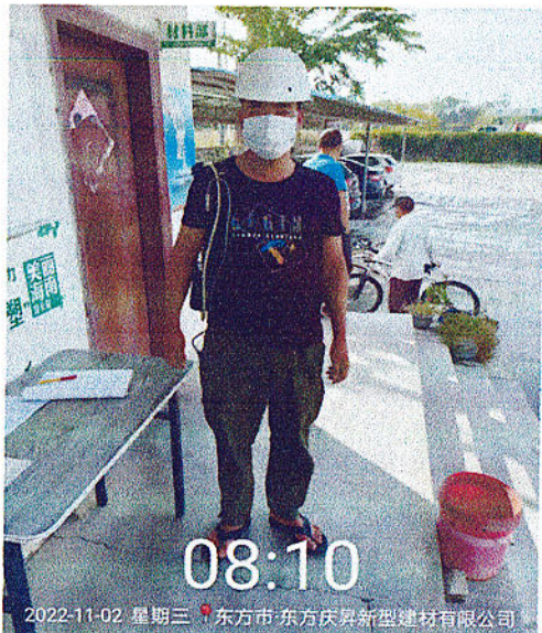
工人个体粉尘检测