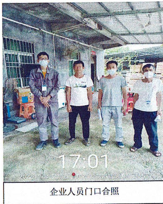
企业人员门口合照