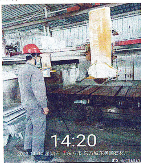
切割操作位粉尘检测