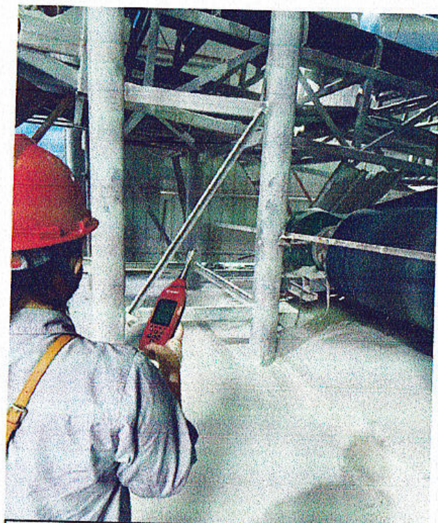
矿粉分离机 噪声检测 2022.10.9