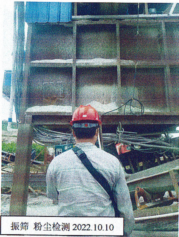
振筛 粉尘检测 2022.10.10