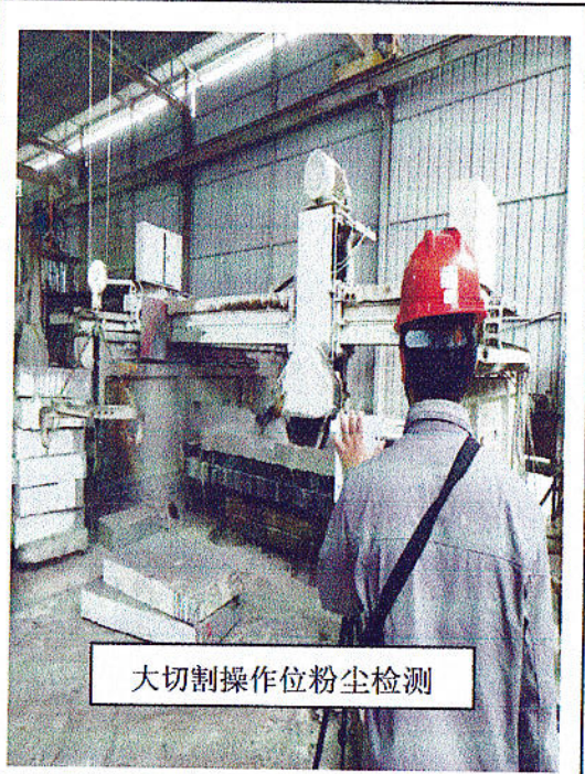
大切割操作位粉尘检测