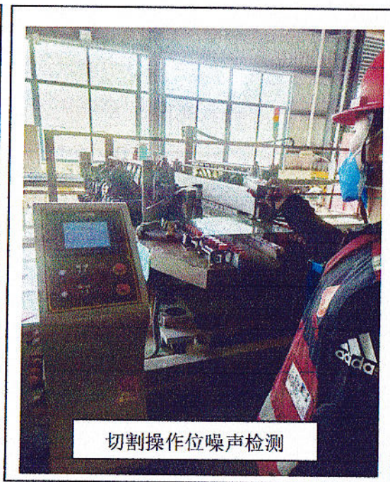
切割操作位噪声检测