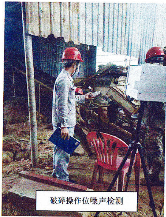
破碎操作位噪声检测