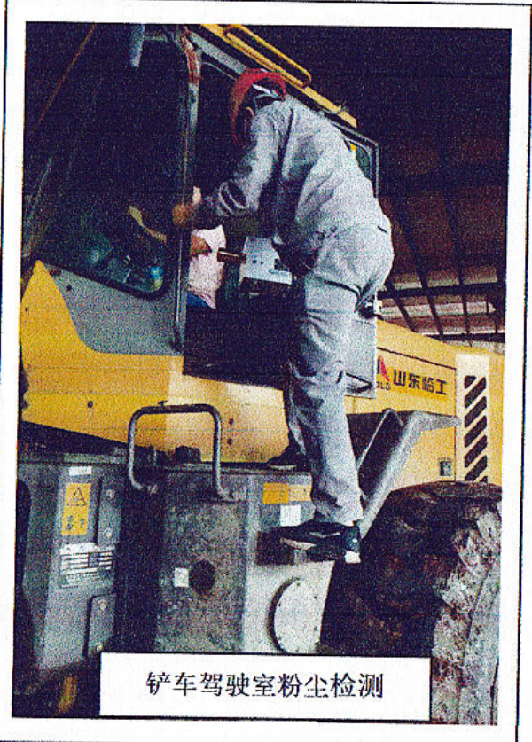
铲车驾驶室粉尘检测