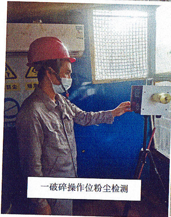
一破碎操作位粉尘检测