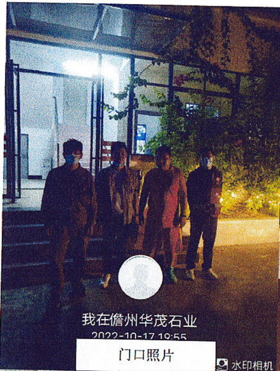
我在儋州华茂石业 2022-10-17 19:55