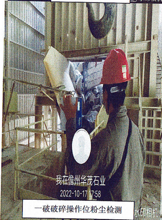
我在儋州华茂石业 2022-10-17 17:58