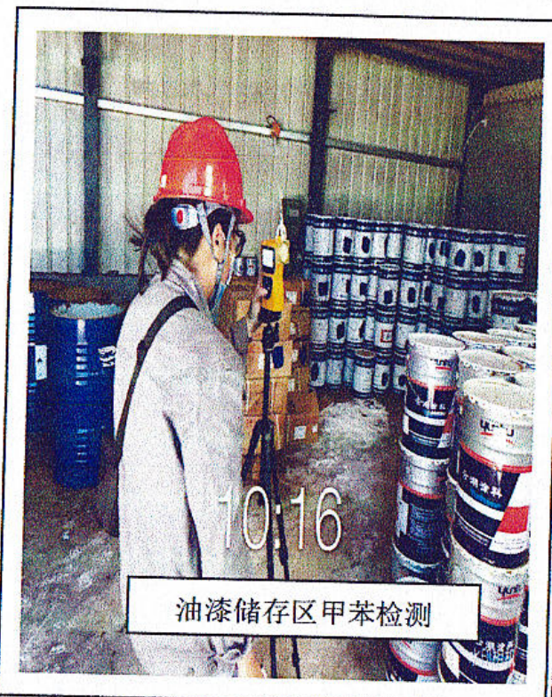
油漆储存区甲苯检测