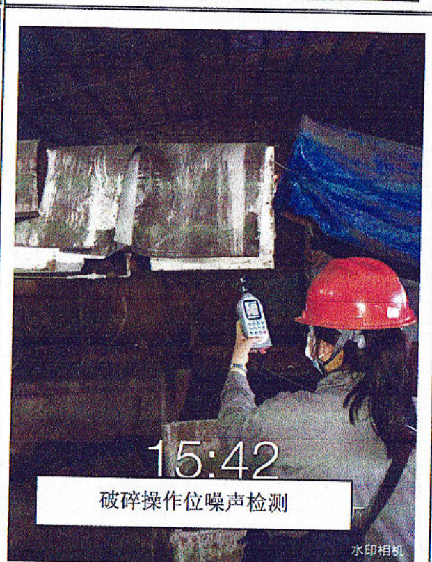
破碎操作位噪声检测