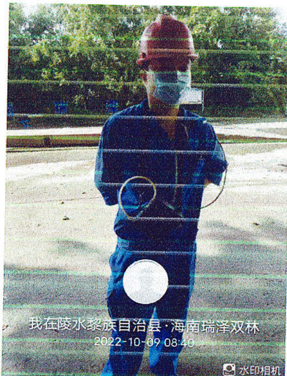
我在陵水黎族自治县·海南瑞泽双林 2022-10-09 08:40