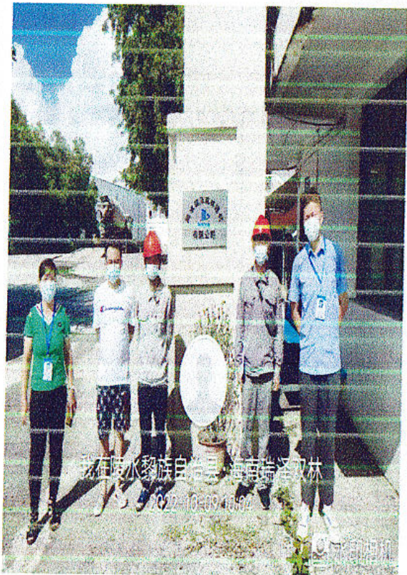
我在陵水黎族自治县·海南瑞泽双林 2022-10-09 10:00