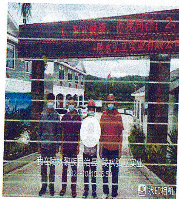
我在陵水黎族自治县·陵水弘立实业 2022-10-10 15:53