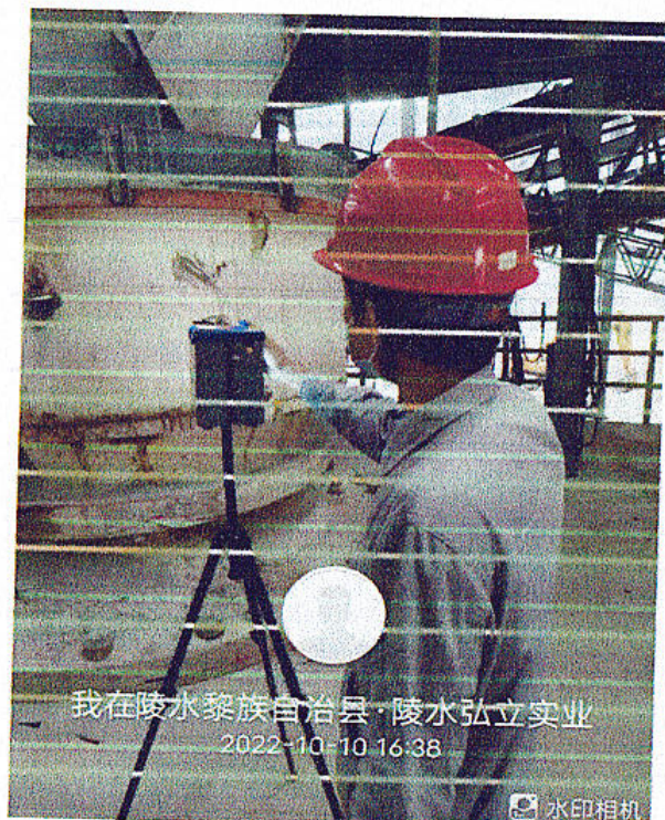
我在陵水黎族自治县·陵水弘立实业 2022-10-10 16:38