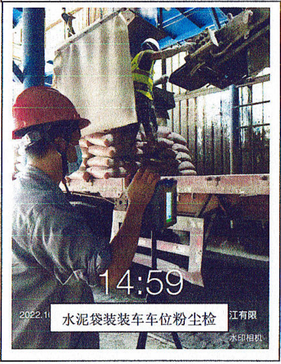
14:59 水泥袋装装车车位粉尘检